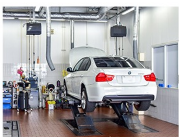
最新設備で効率アップとミス撲滅