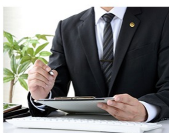
弁護士の相談窓口開設