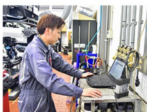
ツールの活用で迅速な診断