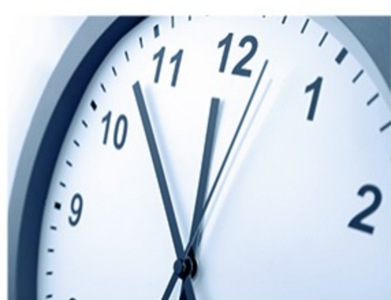
残業時間目標の設定